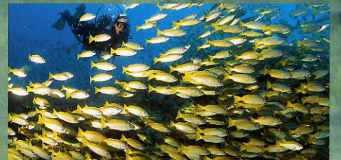
Einmalig: Khao Lak