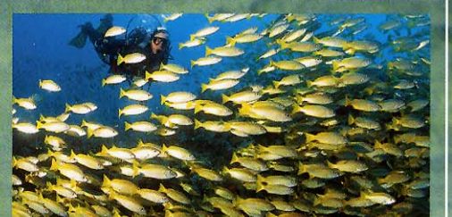
Einmalig: Khao Lak